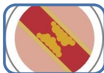
Què cal saber sobre la hipercolesterolèmia