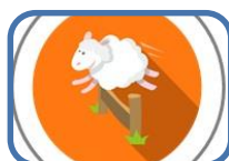
Què cal saber sobre l'insomni