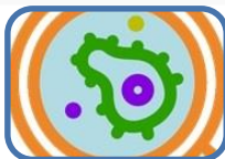
Què cal saber sobre els antibiòtics