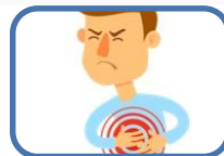
Què cal saber sobre el dolor