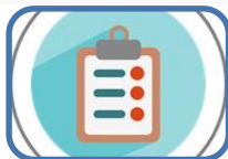
La importància de seguir bé els tractaments