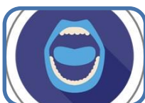
Què cal saber sobre la salut bucodental